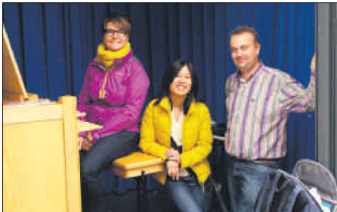
De drie beiaardiers.